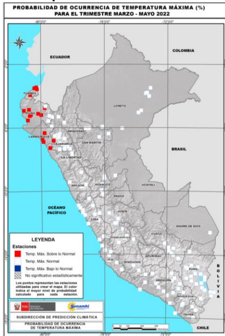
(a) Pronóstico Probabilístico de Temperatura Máxima del aire