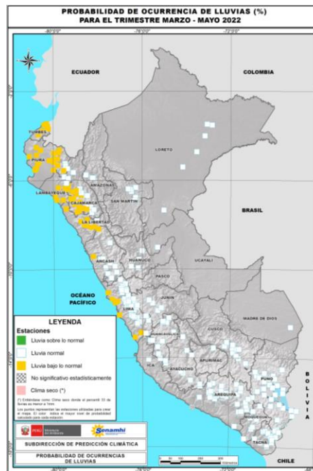
Figura 2. Pronóstico de lluvias para el trimestre marzo - mayo 2022

Nota: En los puntos de coloración rosada climáticamente no se esperan lluvias importantes en las cuencas del Pacífico.